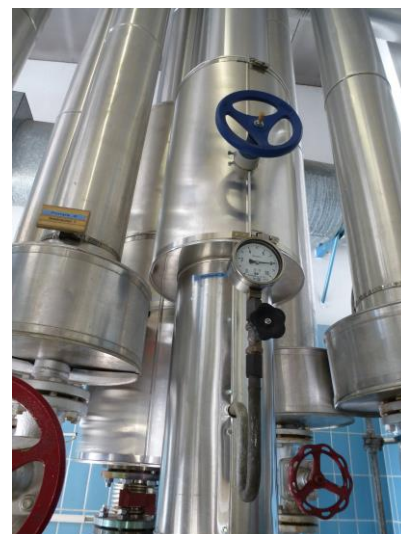
Kessel mit Economiser