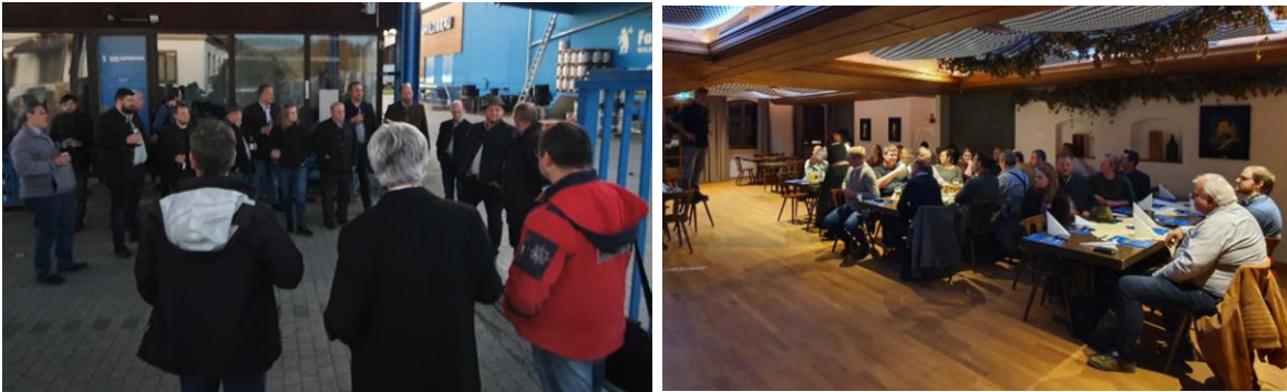
Braumeister-Stammtisch beim Wildbräu in Grafing

Ernst Huber Wärmetechnik GmbH bietet seit über 90 Jahren solide, individuelle Lösungen für thermische Energiesysteme im Bereich Hochdruckheißwasser und Dampf. Vor allem die Einsparung von Primär-Energie durch die effiziente Nutzungs-Anbindung bereits vorhandener Energiequellen machen die Energiesysteme von Huber Wärmetechnik zu kostensenkenden Investitionen für die Zukunft. Mehr als 200 Betriebe - vor allem aus der Brau- und Getränkeindustrie - vertrauen auf die kundenspezifischen Anlagen. Die erfahrenen Mitarbeiter der Huber Wärmetechnik GmbH betreuen ihre Kunden von der ersten Idee bis zur Wartung Jahre nach der Fertigstellung, kompetent und zuverlässig.