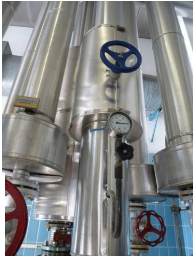
Kessel mit Economiser

Ernst Huber Wärmetechnik GmbH bietet seit über 90 Jahren solide, individuelle Lösungen für thermische Energiesysteme im Bereich Hochdruckheißwasser und Dampf. Vor allem die Einsparung von Primär-Energie durch die effiziente Nutzungs-Anbindung bereits vorhandener Energiequellen machen die Energiesysteme von Huber Wärmetechnik zu kostensenkenden Investitionen für die Zukunft. Mehr als 200 Betriebe - vor allem aus der Brau- und Getränkeindustrie - vertrauen auf die kundenspezifischen Anlagen. Die erfahrenen Mitarbeiter der Huber Wärmetechnik GmbH betreuen ihre Kunden von der ersten Idee bis zur Wartung Jahre nach der Fertigstellung, kompetent und zuverlässig.